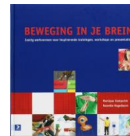
Beweging in je brein