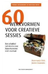
60 werkvormen voor creatieve sessies