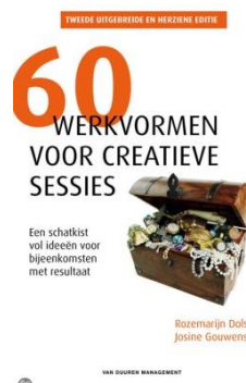
60 werkvormen voor creatieve sessies